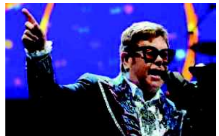
Le concert de ce soir se jouera-t-il à guichets fermés ?

Il est en concert ce soir à l'Arkea Arena. Portrait en sept anecdotes méconnues de la superstar anglaise aux dizaines de tubes.