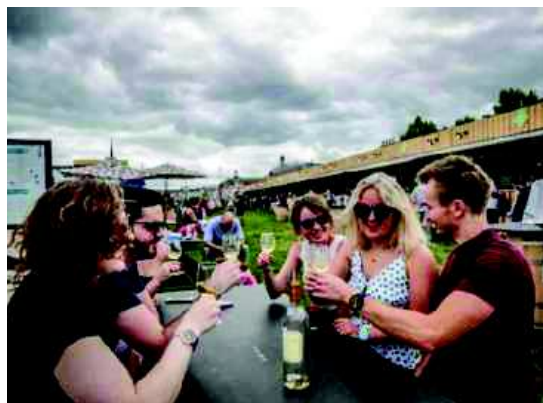
Les visiteurs peuvent s'attabler face aux voiliers.

« Ce produit plaît de plus en plus. À Bordeaux, nous sommes la deuxième région de France après l'Île-de-France à consommer le plus de champagne. Il y a quelque chose à faire avec le crémant. »